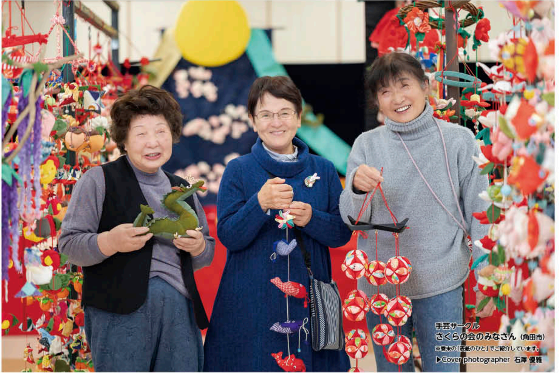
手芸サークル さくらの会のみなさん (角田市) ※巻末の「表紙のひと」でご紹介しています。

●毎月10日発行 ●発行部数 72,538部 (うちポストイン 68,132部) ●ポストインエリア 岩沼市 / 名取市 / 亶理町 / 山元町 / 柴田町 / 大河原町 ●設置エリア 村田町 / 角田市 / 白石市 発行：株式会社コミュニケーションズ