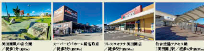
美田園風の音公園 / 徒歩1分(約50m) | スーパービバホーム新名取店 / 徒歩3分(約200m) | プレスコキクチ美田園店 / 徒歩5分(約320m) | 仙台空港アクセス線「美田園」駅 / 徒歩4分(約320m)