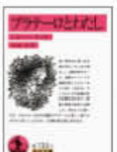
プラテロとわたし

ヒメーネスは19歳の時に良き理解者であった父を亡くし、心を病みますが、首都マドリッドから故郷アンダルシアに戻り、美しい自然に囲まれて静養した中で、この「プラテロとわたし」の大部分を書き上げます。一編一編がそれ自体で完成した作品で、フィクションを加味した散文詩となっています。ロバと暮らす日々々に夫婦共々感謝しています。