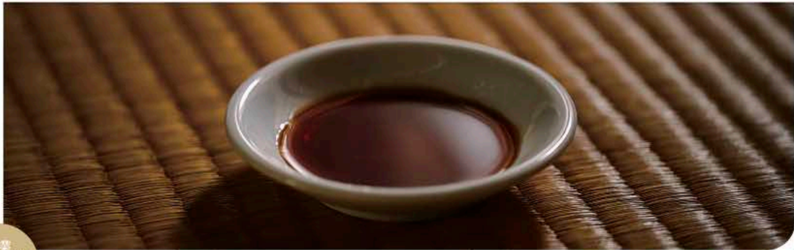
撮影場所：永田醸造社直（国登録有形文化財）